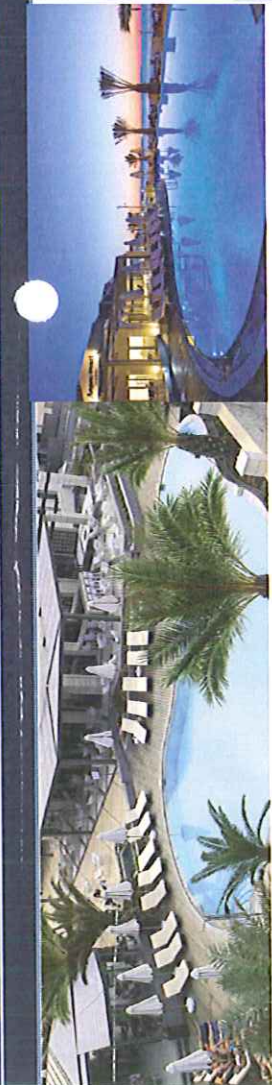
KRETA, 12. – 26.oktober 2013: